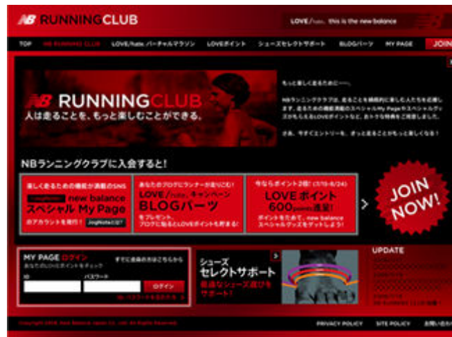
NB RUNNING CLUB トップページ

株式会社ニューバランス ジャパン(本社:東京都中央区、代表取締役社長:林 喜弘)は、新しいブランドキャンペーン「LOVE/hate. this is the new balance」展開に連動し、2008年7月15日(火)よりランニングコミュニティサイト「NB RUNNING CLUB」をオープンいたします。また、新しいブランドキャンペーン立ち上げに際し、オフィシャルホームページもリニューアルいたします。ニューバランスはランニングカンパニーとして、ランニングに対するあらゆる葛藤を「LOVE」と「hate」という感情の中の微妙な関係で捉え、ランナーの気持ちに寄り添いランニングをより楽しんでいただけるようサポートしてまいります。